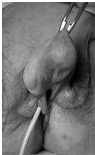
Figura 2. Clitoromegalia.

En niñas prepuberales normales el glánde clitorideo mide 3 mm de diámetro, si es mayor de 5 mm o el índice (longitud x ancho) es mayor de 35 mm, sugiere exposición a andrógenos (11). Por lo tanto, el médico debe recordar que todo recién nacido aparentemente masculino, pero criptóquido, resulta sospechoso de pseudohermafroditismo femenino (Figura 2) y que el clítoris que mida más de un centímetro antes de la pubertad, se halla agrandado y requiere la investigación de un factor androgenizante.