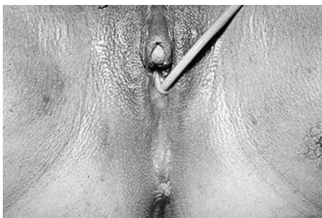
Figura 4. Hiperplasia suprarrenal congénita de expresión tardía.

tardíamente, en etapas puberales que algunos la definen como de “expresión o de aparición tardía” y estará representada por hiperandrogenismo y franca virilización.