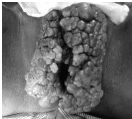
Figura 8. Condilomatosis vulvar y ocultamiento del clítoris.

Las enfermedades de transmisión sexual pueden envolver toda el área perineal y vulvar y por lo tanto el clítoris; algunas de ellas se han incriminado en la aparición de tumores malignos de la región vulvar. El condiloma acuminado ocasionado por virus del papiloma humano (Figura 8) ha sido asociado a cáncer del clítoris (48). En 1991 se reportó un caso de un condiloma gigante de vulva y clítoris — tumor de Buschke-Lowestein— en el que se detectó DNA de VPH en núcleos celulares del epitelio escamoso con cambios coilocíticos (49). Hampl y col. (50) en el año 2006, reportaron el caso de una joven de 18 años con infección micótica a quien se le diagnosticó pocos meses después un carcinoma localizado entre la uretra y el clítoris.