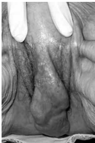
Figura 10. Neurofibroma.

En pacientes jóvenes con liquen escleroso puede ocurrir sangrado alrededor del clítoris, equimosis ocurren con los traumatismos y edema en los casos de hipoproteinemia o cuadros de síndrome nefrótico. Las hipertrofias del capuchón del clítoris y el mismo clítoris pueden ser vistas en la neurofibromatosis (Figura 10), hemangiopericitomas o rabdomiosarcomas .