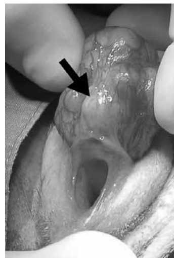
Figura 11. Adenocarcinoma de clítoris en una perra. (referencia N°. 62).

El clítoris puede ser asiento de una lesión del tejido celular subcutáneo, rara benigna llamada pilomatrixoma o pilomatrixoma (y de su variedad maligna el pilomatrixoma epiteliode calcificamente de Malherbe) que aparece en niños y adolescentes, dura, formada por tejido epitelial momificado y calcificado con células parecidas a las de la matriz del pelo, son de forma redondeada, o irregular y con cierta movilidad (62,63). En el Cuadro 2 podemos observar otras raras condiciones patológicas que se han descrito a nivel del tubérculo genital.