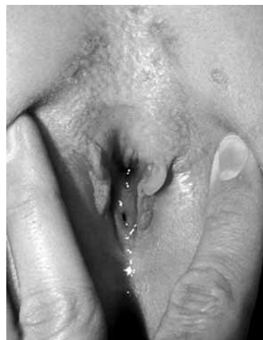
Figura 6. Clítoris bífido y uretra amplia en una niña.

bífido acompaña al epispadias y a la extrofia vesical.. El meato uretral anormalmente alto, se halla entre dos hemiclítoris en el epispadias anterior o clitorídeo y requiere uretroplastia, seguido de la unión de los 2 hemiclítoris. Además de la asociación con la extrofia vesical, se puede observar en prolapsos vaginales congénitos y duplicaciones vaginales, urinarias e intestinales (4).