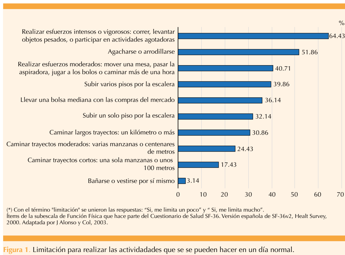
Figura 1. Limitación para realizar las actividades que se se pueden hacer en un día normal.

La histerectomía en premenopausia, con o sin ooforectomía, se asoció con limitación para llevar a cabo actividades vigorosas o moderadas, lo que no se observó si la cirugía se practicó durante los años de posmenopausia. Hallazgo de interés, aunque sin posibilidad de establecer comparaciones porque no se identificaron estudios similares. A pesar de ello sí se han señalado otros efectos no deseados de la histerectomía. La Iniciativa de Salud de la Mujeres 35 informó que la histerectomía con ooforectomía se relacionó con infarto cardiaco y muerte por coronariopatía y el riesgo fue mayor conforme a menor edad se practicó la ooforectomía. La histerectomía antes de los 45 años incrementó dos veces el riesgo de accidente cerebrovascular. 36,37,38 Finch y colaboradores 16 encontraron que después de la